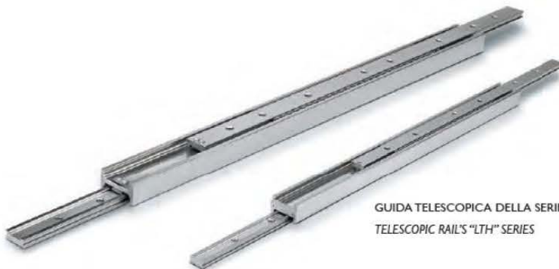
GUIDA TELESCOPICA DELLA SERIE LTH TELESCOPIC RAILS "LTH" SERIES

Rollon has created several applications for the contract sector, both luxury hotels and retail. The most appreciated items in the luxury sector concern handling systems for display units, such as pull-out and sliding display units, reception desks with sliding doors, round rotating beds (360° or 180°), tilting tops, living walls with built-in aquariums, etc. Over the years Rollon, with headquarters based in Vimercate, has achieved international leadership in the field of linear handling systems by focusing on several key factors. The core feature is the capacity to develop in-house, through its own R&D Department, customised solutions-based on the client's needs that are also fine-tuned to meet market demands. Rollon also offers a complete product range-linear rails and actuators-studied to offer a solution to all project requirements. Rollon is present worldwide both through direct offices (in France, Germany, the United States and China) and an intensive network of distributors to guarantee prompt assistance and quality consulting services even in emerging countries where the company is currently consolidating its presence.